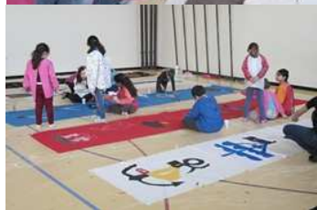
Les artistes à l'œuvre...